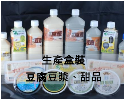
生產盒裝 豆腐豆漿、甜品