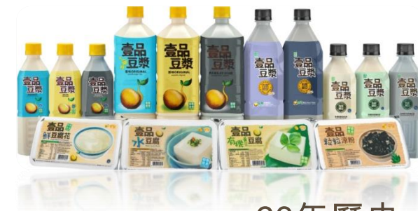
60年歷史 產品超過50款