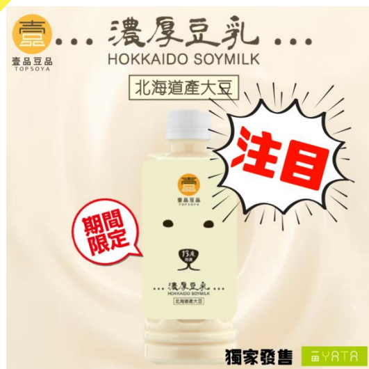
壹品北海道濃厚豆乳