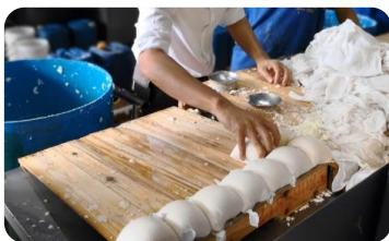
傳統手工豆腐工場